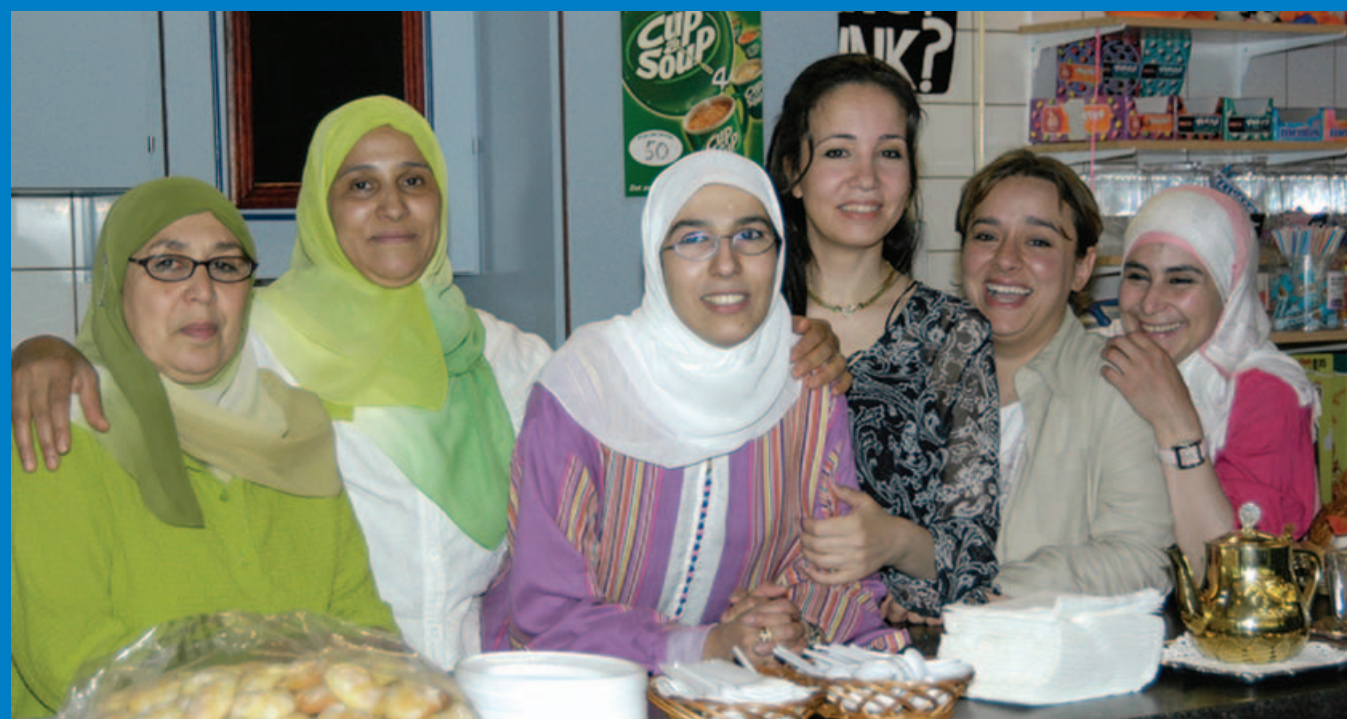
De vrouwen van Zohor